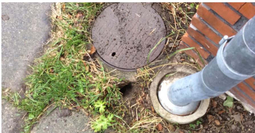
Rottehul ved tagbrønd