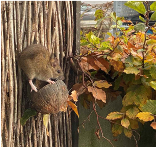
Rotte på fuglefoder