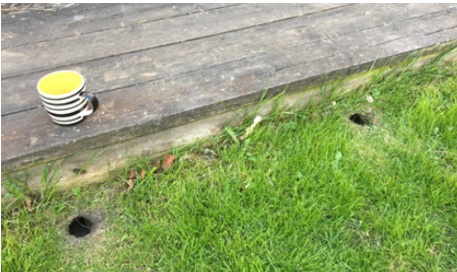
Rottehuller ved træterrasse